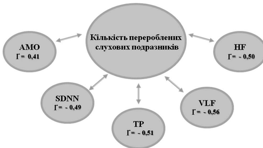
Рис. 1. Кореляції між кількістю перероблених слухових подразників і характеристиками серцевого ритму ( P < 0,05 ): AMO – амплітуда моди, SDNN – стандартне відхилення інтервалів R-R ЕКГ, TP- сумарна потужність спектра, VLF – потужність спектра на дуже низьких частотах, HF – потужність спектра на високих частотах

Порівняння показників ВСР при виконанні завдання у групах свідчить про наявність статистично значимих різниць, які проявились у істотно нижчих медіанах, спектральних TP, VLF, HF і варіаційних SDNN показників у обстежуваних з високим рівнем порівняно з низьким ( P < 0,05 ; рис. 2). Показники ВСР обстежуваних з середнім рівнем у більшості випадків