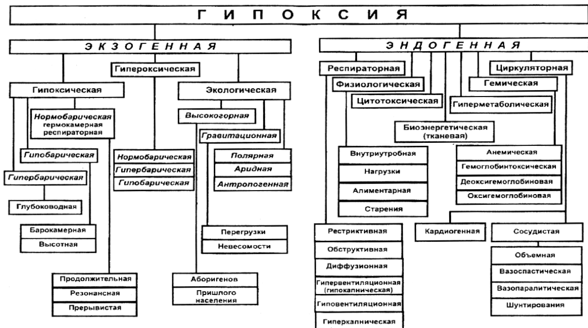
Рис. 1. Классификация гипоксических состояний по Агаджаняну и Чижову (1998).

Любое гипоксическое состояние – достаточно сложный комплекс ответных реакций на гипоксический стимул, в который, как правило, включены все функциональные системы организма, в связи с чем гипоксия в большинстве случаев бывает смешанного типа. В каждом конкретном случае необходимо учитывать индивидуальные, возрастные, половые, эт-